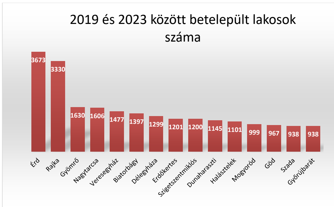
2. ábra 2019 és 2023 között betelepült lakosok száma

A következő ábrán konkrét számadatokat láthatunk, hogy mennyivel változott a lakosság a fenti településeken a vizsgált időszakban.