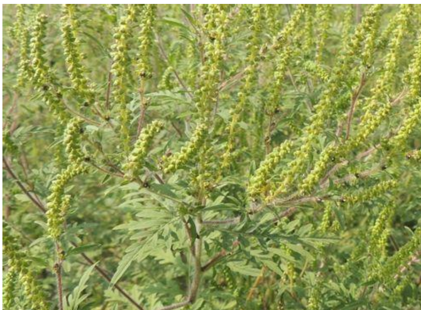
Parlagfű teljes virágzásban