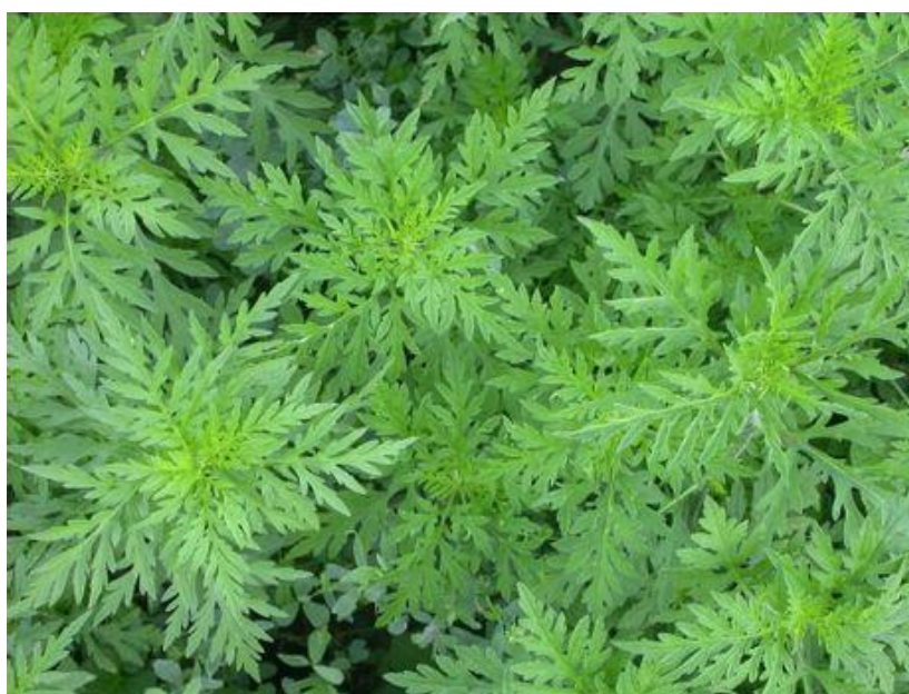
Parlagfű száras-leveles állapotban

Amennyiben a helyszíni ellenőrzés során megállapításra és a jegyzőkönyvben rögzítésre kerül, hogy a területen a parlagfű még száras-leveles állapotban van, hatósági eljárás nem indítható, ugyanakkor az érintett ingatlan földhasználójának figyelmét fel lehet hívni a parlagfűmentesítési kötelezettségre.