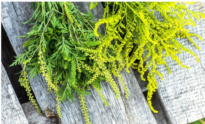
Parlagfű, mellette a szintén allergén kanadai aranyvessző

https://efop180.antsz.hu/tajekoztatok-kornyezeteu/tajekoztatok-kornyezeteu-tajekoztatok.html