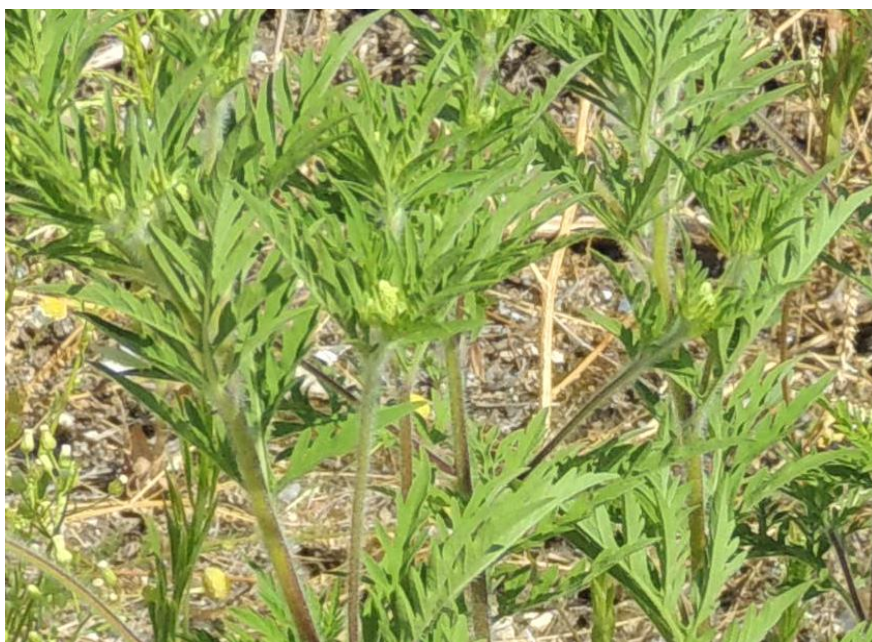
Parlagfű korai virágbimbós állapotban

Amennyiben a helyszíni ellenőrzés során megállapítást nyer, hogy a belterületi ingatlan használója nem tett eleget az Éltv. 17. § (4) bekezdésben előírt parlagfű elleni védekezési kötelezettségének, és a területen virágbimbós, vagy attól fejlettebb állapotú parlagfű található, a jegyző a parlagfű elleni közérdekű védekezés végrehajtásának, valamint az állami, illetve a közérdekű védekezés költségei megállapításának és igénylésének részletes szabályairól szóló 221/2008. (VIII. 30.) Korm. rendelet (a továbbiakban: Vhr.) 3. § (5) bekezdése szerinti jegyzőkönyvet vesz fel a helyszíni ellenőrzésről.