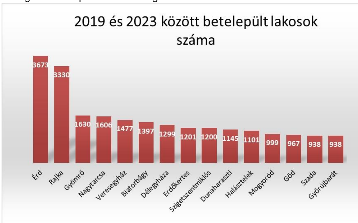
2. ábra 2019 és 2023 között betelepült lakosok száma

A következő ábrán konkrét számadatokat láthatunk, hogy mennyivel változott a lakosság a fenti településeken a vizsgált időszakban.