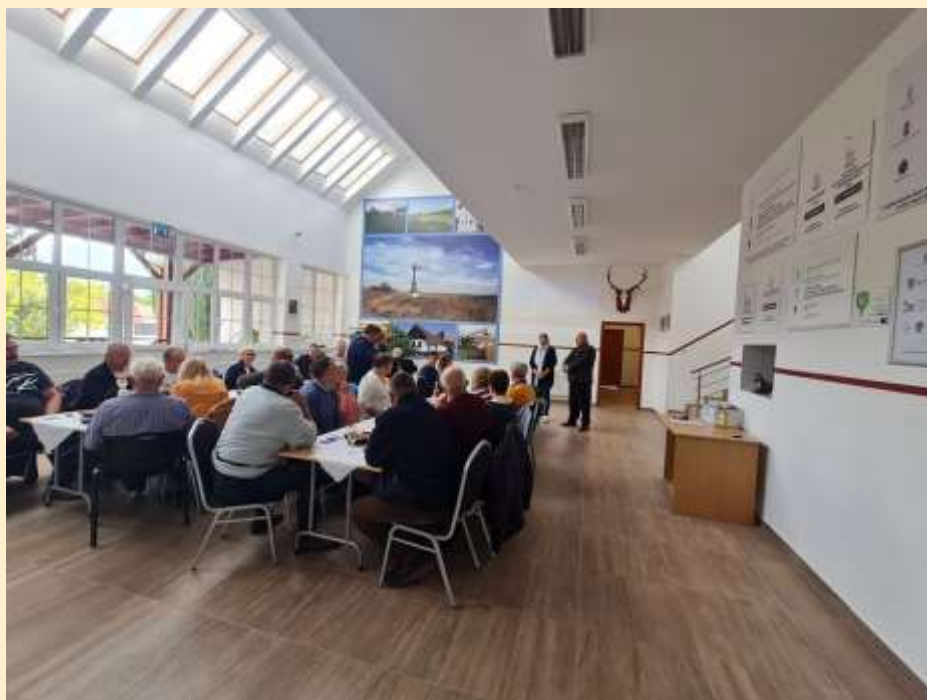
3. ábra - Püspökszilágyon bemutatásra került a rönkgátakból, hordalékfogókból és oldaltározóból álló komplex vízmegtartó rendszer