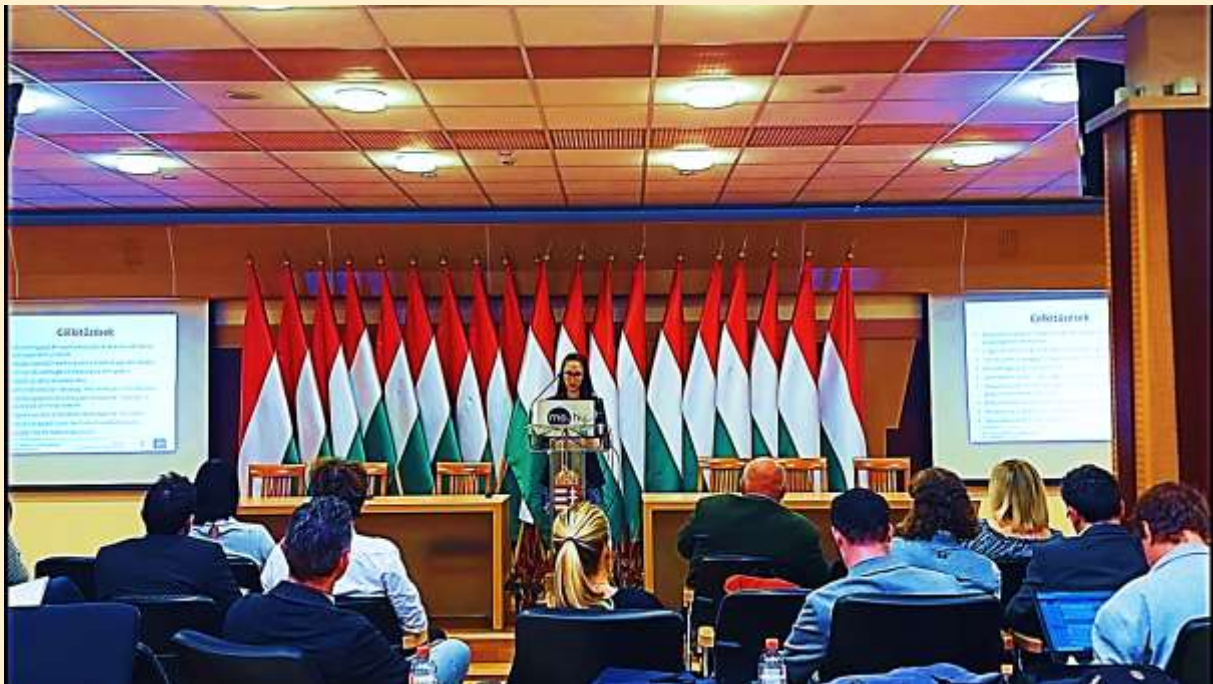
Első szakmai munkaértekezlet a konzorcium részvételével

A Belügyminisztérium koordinálásában 2021. október 1-jével indult LIFE20 CCA/HU/001604 azonosítójú „ Innovatív vízgazdálkodási módszerek integrált gyakorlati alkalmazása vízgyűjtő szinten önkormányzati koordinációval ” című LIFE LOGOS 4 WATERS projekt átfogó célkitűzése – a jelenleg futó LIFE-MICACC projekt tapasztalataira és eredményeire is építve – a helyi önkormányzatok éghajlatváltozáshoz való alkalmazkodási és koordinációs képességeinek megerősítésével , illetve a témához kapcsolódó pályázati (hazai és közvetlen EU-s) források lehívásának és hatékony felhasználásának támogatása , továbbá a természetes vízmegőrző megoldások népszerűsítése, települési és vízgyűjtő szintű alkalmazásának elősegítése Magyarország vízvesztő pozíciójának mérséklése érdekében.