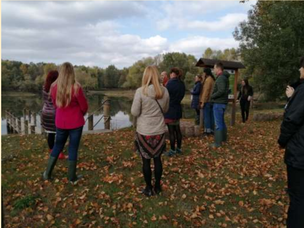
9. ábra - Tiszatarjánban egy újabb medencével bővült a meglévő kubikgödör-rendszer, így növelve az ártér árvízbefogadó képességét

Készítette: Csizmadia Petra Belügyminisztérium, Önkormányzati Koordinációs Iroda