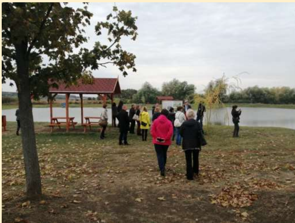
7. ábra - Rákócziújfaluban a belvízelvezető-csatornára épített szabályozható zsilippel a mélyebb fekvésű tározóba kormányozható a többletvíz