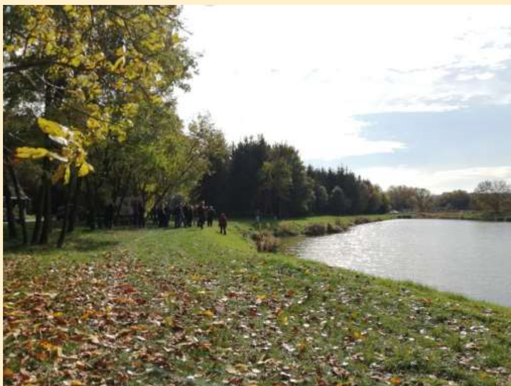
6. ábra - A püspökszilágyi oldaltározó őszi arca