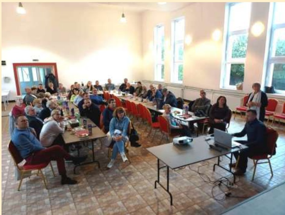
4. ábra - Előadás Rákócziútfalun a belvízelvezető csatorna vízmegtartás céljából történt átalakításáról

Készítette: Hercig Zsuzsanna Belügyminisztérium, Önkormányzati Koordinációs Iroda