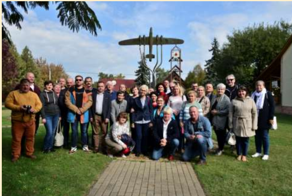
1. ábra - Ruzsán a lengyel gazdák megtekintették a második világháborúban, a település közelében lezuhant lengyel katonáknak emléket állító emlékművet is

A LIFE-MICACC projektről bővebb információ a projekt honlapján található: https://vizmegtartomegoldasok.bm.hu/hu