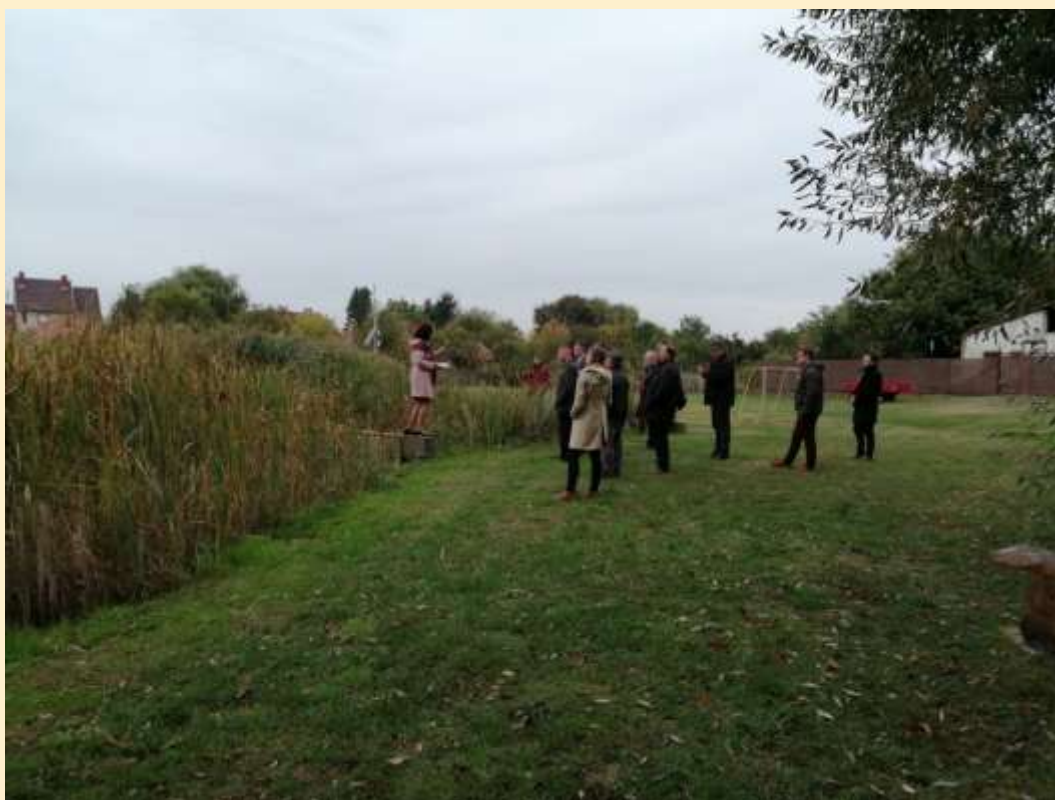
8. ábra - Polgármester asszony lelkesen mutatja a roadshow résztvevőknek a Ruzsán elkészült kis belterületi tavat, melyben a helyi vízműből kifolyó dekant vizet tartják meg