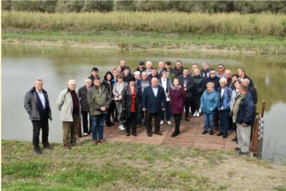
2. ábra - Csoportkép a régi agyaggödör helyén kialakított bátyai tározó tónál