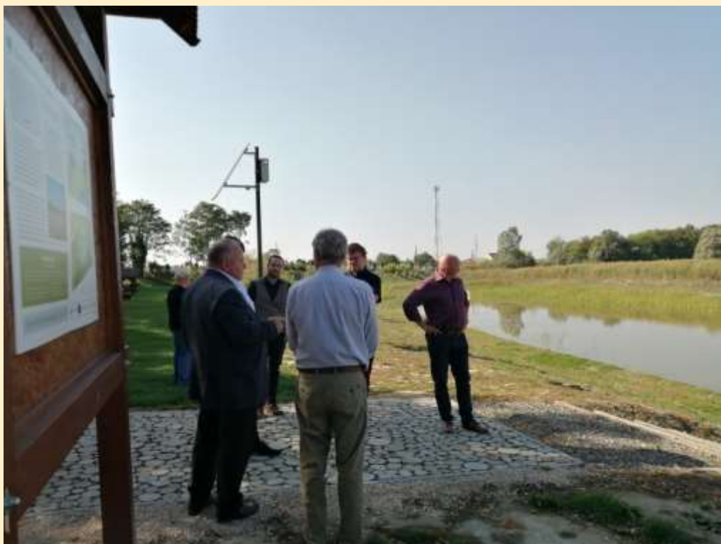
5. ábra – A LIFE-MICACC projektben kialakított bátyai tározótó a TOP-nak köszönhetően a település csapadékvizének egy részét is befogadja