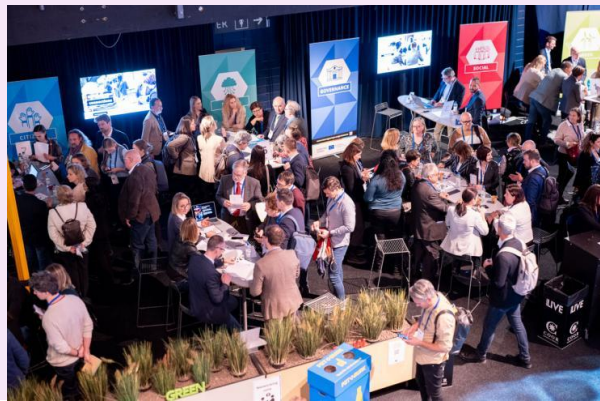
Az Interregional Cooperation Forum 2023. március 15-én került megrendezésre, Stockholmban.