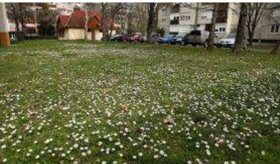
Meghagyó kaszálással ilyen szép és étellel teli virágos rétjeink lehetnének a településeken is