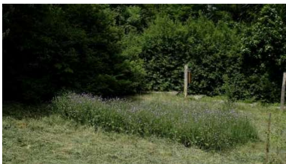
Már egy ekkora nyíratlan területrész is ökológiai oázist jelent a lenyírt részek bűvőhelyet nem kínáló, tűző napnak kitett, kiszáradó, legalább ideiglenesen csökkent minőségű élőhelyén

Konkrét számokat említve – a legkisebb kertekben is meghagyható legalább 1-2 m 2 , parkokban, lakótelepeken pedig akár 50-100 m 2 is.