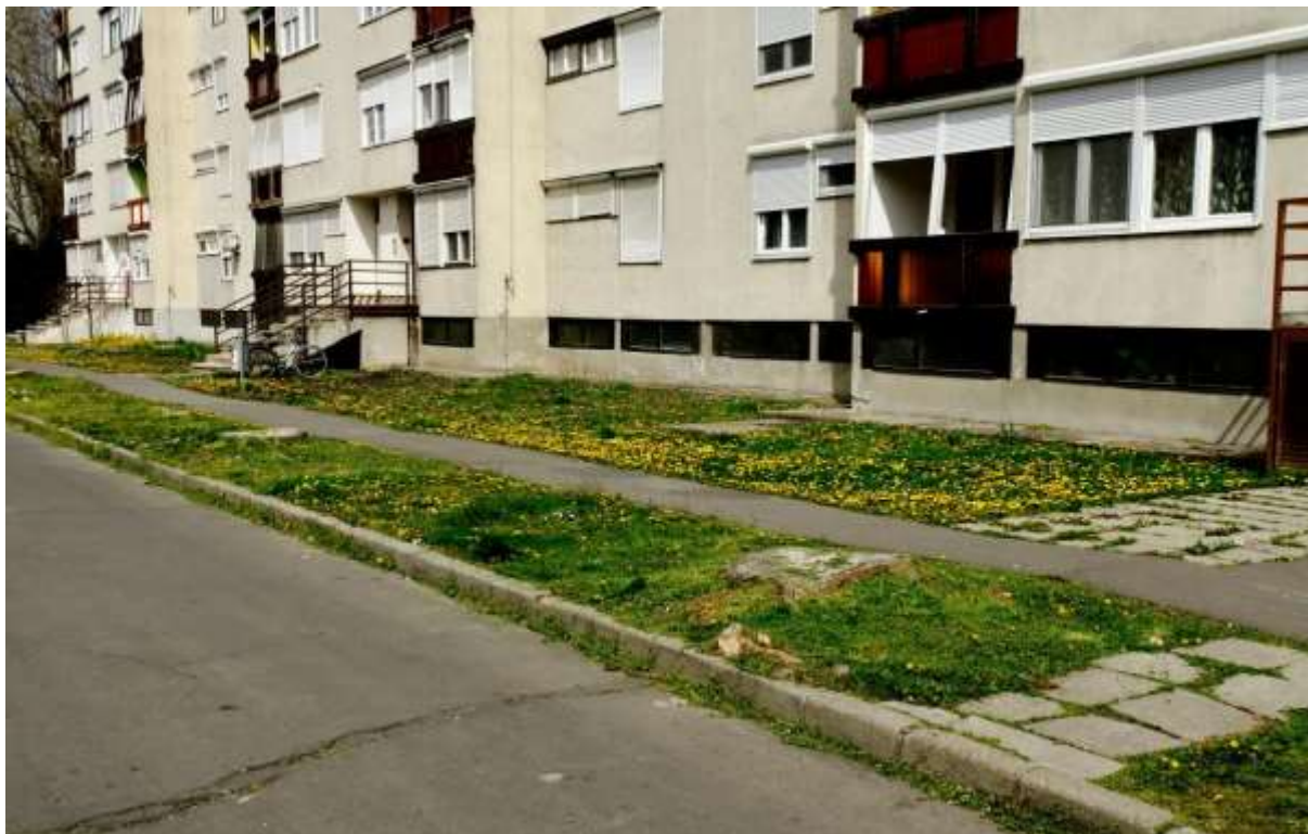
A közterületi zöldfelületeken a nyíratlan területrészek kijelölésénél segítséget jelenthetnek a járdák, utak, épületek által kijelölt kazetták

Aránymegközelítést alkalmazva – már a 10%-os meghagyás is jelentős környezeti előnyt jelent, ami akár 20-30 (50) % is lehet. A lakótelepek mozaikos zöldfelületei esetén pedig jó megoldás, ha egy-egy ilyen, például a járdák által körbevett gyepekazettákat hagynak meg a parkogató munkások.