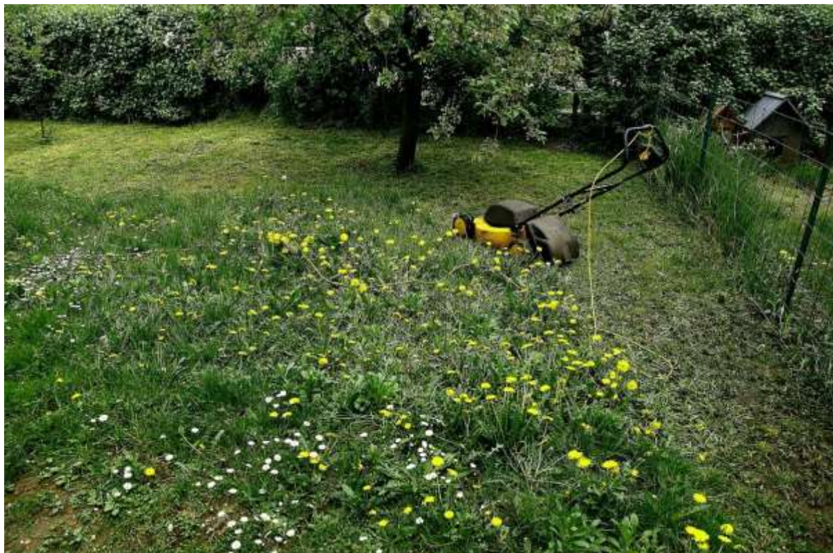
A természetbarát zöldfelület-gondozás egyik nagy előnye, hogy ha kevesebbet dolgozunk, általában nemcsak magunkat kíméljük, de az eredmény is környezet- és lakosságbarátabb lesz

A lényege, hogy ne nyírjuk le a fűvet egyszerre mindenhol, a terület adottságaihoz igazodva hagyjunk meg nyíratlan egybefüggő foltokat.