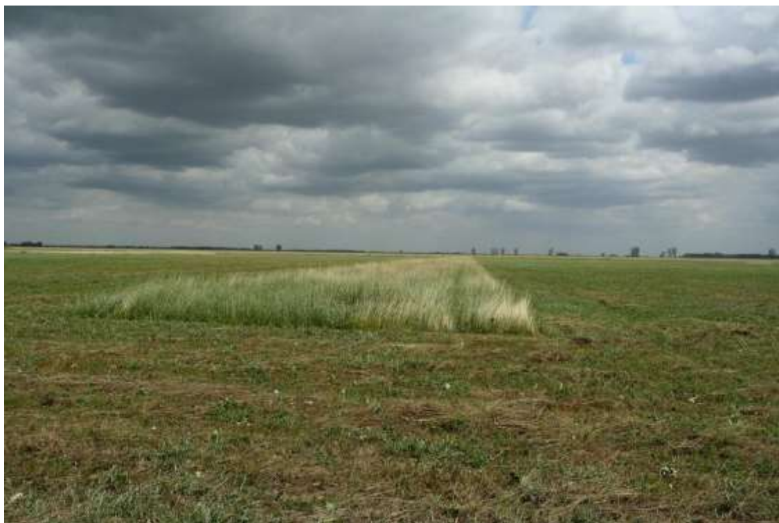
A meghagyó kaszálás ökológiai sivataghatást megelőző szerepe olyan fontos, hogy a természetkímélő agrárgazdálkodás eszköztárában is szerepel – például a képen látható, kékvércsetelep melletti élőhelyen