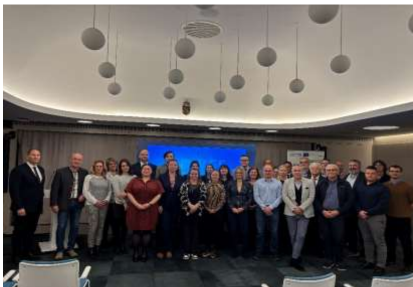
LOCALIENCE projekt Tudásnap Önkormányzatoknak (2025. 11. 20)

A LOCALIENCE projekt központi eleme, hogy a különböző országok szakmai szereplői közösen dolgozzanak ki olyan eszközöket, módszertanokat és ajánlásokat, amelyek közvetlenül támogatják a települések felkészültségét. Ennek keretében többek között létrejött egy, a szélsőséges időjárási eseményeket rendszerező katalógus, valamint olyan értékelési és együttműködési modellek, amelyek segítik a helyi szereplők – önkormányzatok, hatóságok, civil szervezetek – közötti hatékony koordinációt.