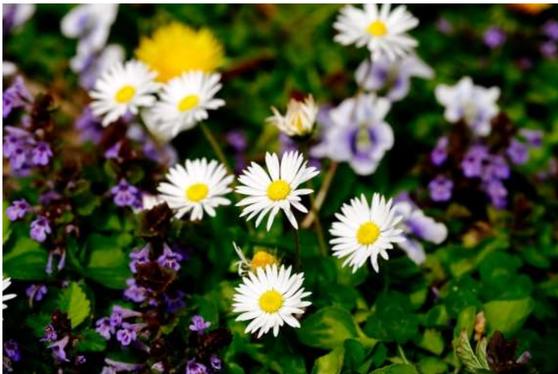
A százszorszép, de több más gyeptársulásban élő lágyszárú virág is képes 5-10 cm-es száron virágozni, magot termelni, ezért a magasabbra állított vágópengékkel végzett fűnyírás is természetkímélőbb